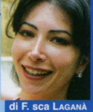
di F. sca LAGANA